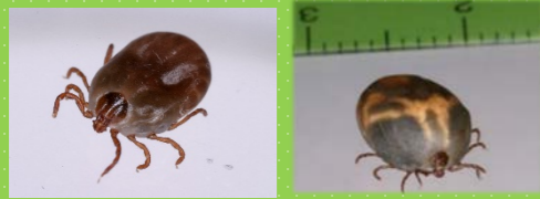
フタトゲチマダニ

ペットにマダニがついていないかチェック！ マダニがいるのは、草むらや山林などです。 たいてい草むらの葉っぱの先端や裏側にいて、動物や人が近づくと、その体に飛び移って吸血します。吸血する際にウイルスが感染します。 猫が外から帰ったり、犬と散歩から帰ったら、マダニがつきやすい頭、耳、指の間、顔まわりなどを重点的にチェックしてあげましょう。