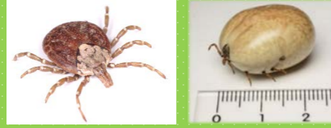
タカサゴキアラマダニ